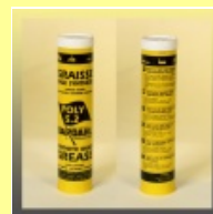
BARDAHL POLY S2 Vollsynthesefett Kartusche 400 g